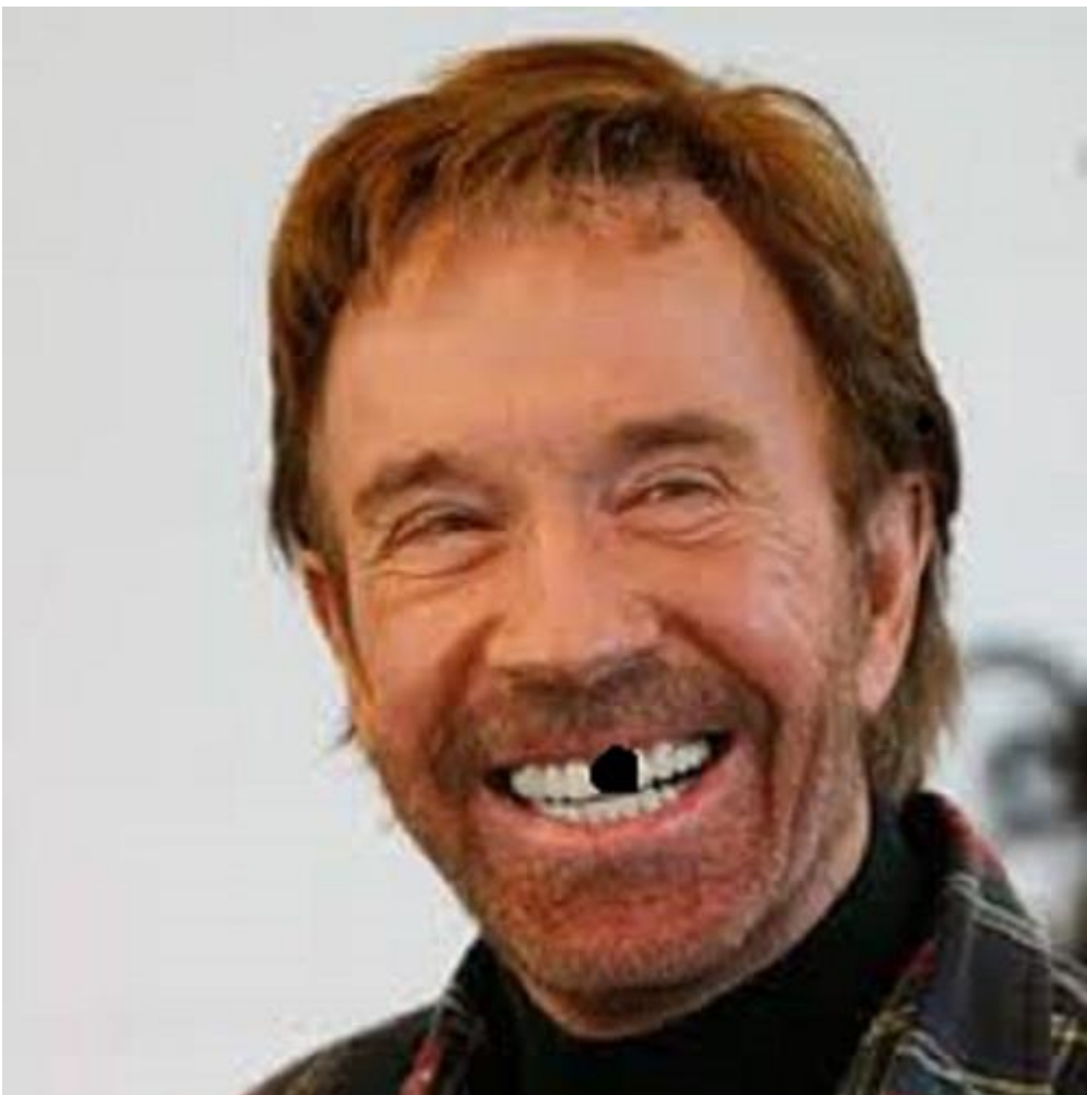
Credo non ci sia molto da aggiungere. È palese che questo utente di Instagram ha problemi dentari, un professionista può consigliarlo e guadagnare una paccata di soldi.